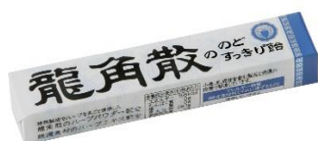
龍角散ののどすっきり飴 スティック

ご興味ある方は下記のニューロン製菓ホームページの採用情報をご確認の上、ご応募ください。