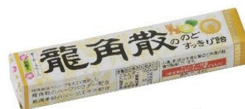
龍角散ののどすっきり飴 シークワーサー味 スティック