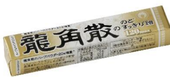
龍角散ののどすっきり飴 120max スティック