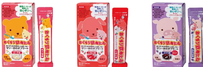
携帯に便利なスティックタイプ（ピーチ味 いちご味 ぶどう味）