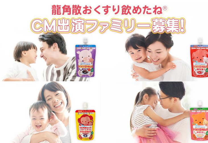
※募集キャンペーンサイト TOP 抜粋

募集キャンペーンサイト（ ryukakusan-pr.jp/cm-campaign ）から、応募フォームに必要事項をご記入の上、親子で写っている写真をアップロードするとご応募いただけます。その後、応募いただいたご家族の中から選考の上、10組程度のご家族にCM撮影へご参加いただく流れとなっております。