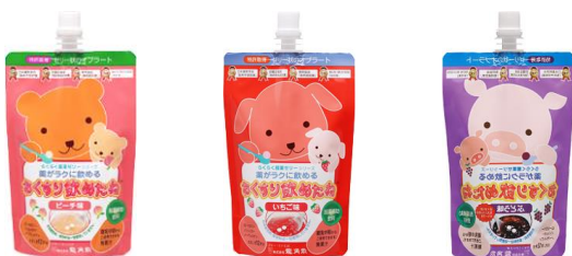
お子さまが好きなフルーツ味（ピーチ味 いちご味 ぶどう味）